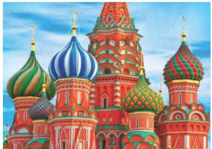
Catedral de São Basílio, Moscou